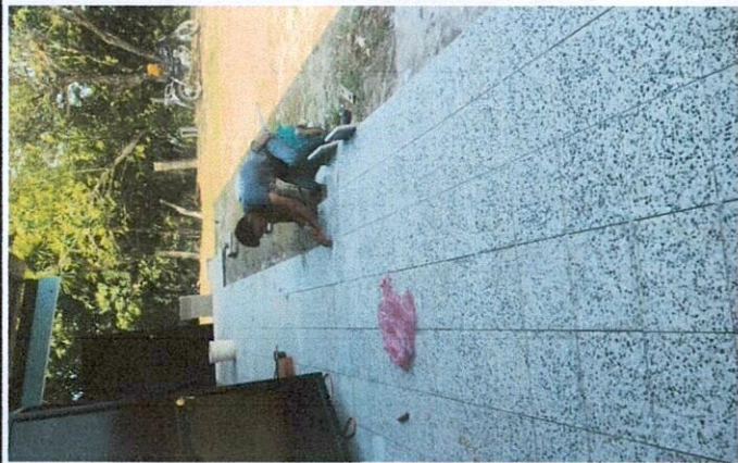
Foto 3: Avances mejoramiento de piso de torta a piso tipo granito