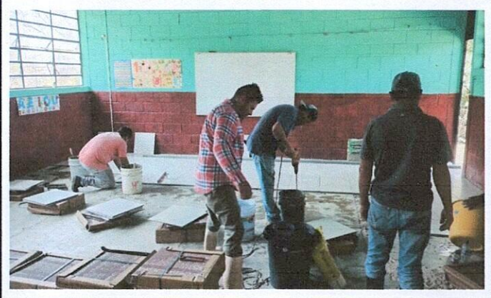
Foto 2: Avances mejoramiento de piso de torta a piso tipo ceramico